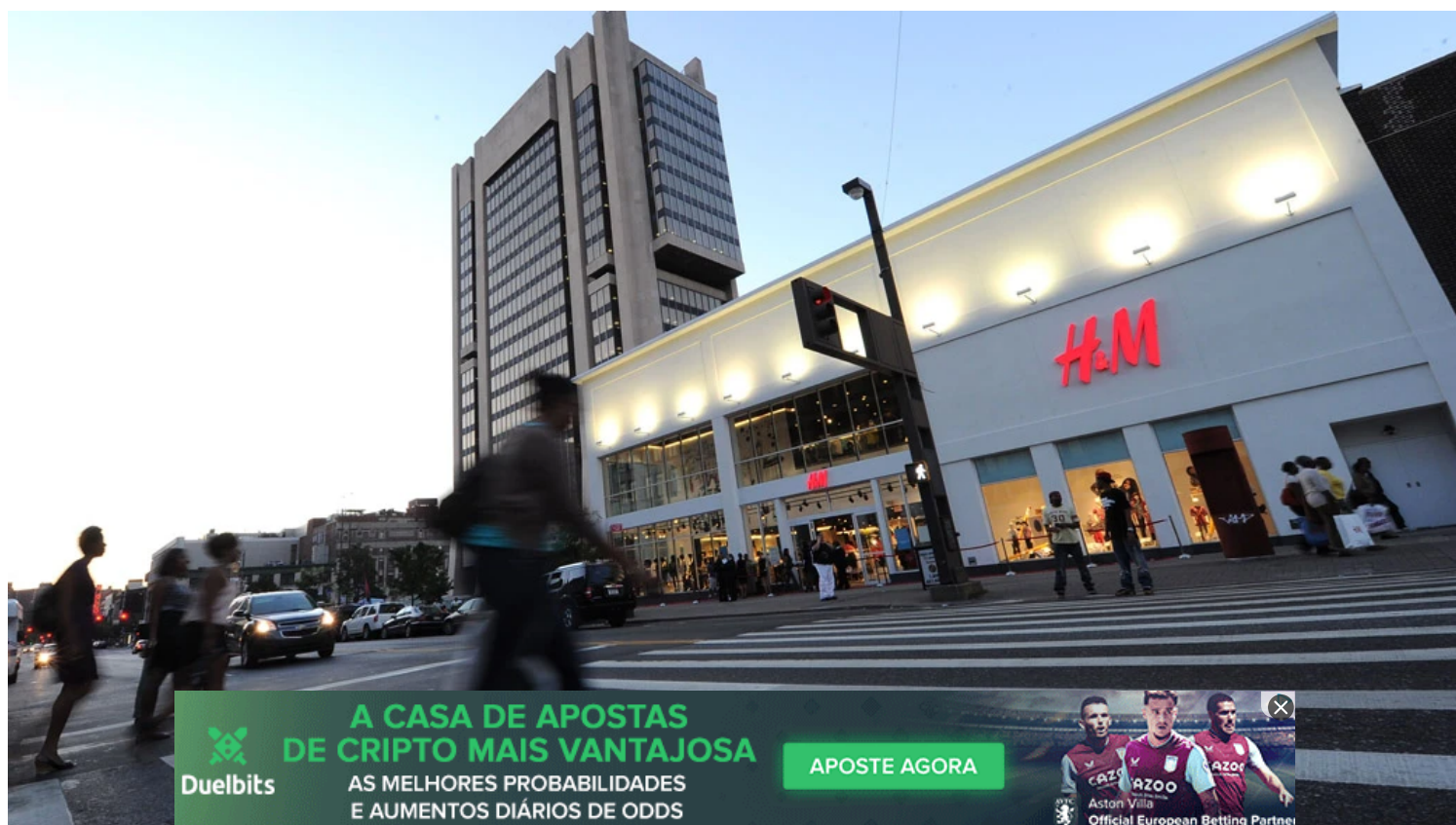
Fachada da loja H&M em Nova York